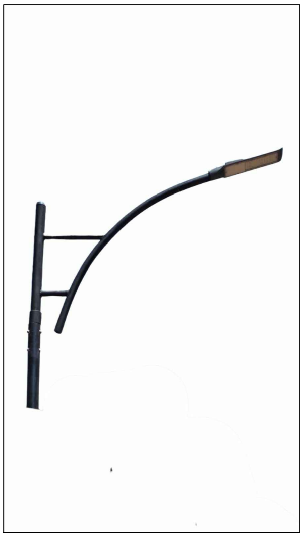
ILUSTRAÇÃO BRAÇO ORNAMENTAL